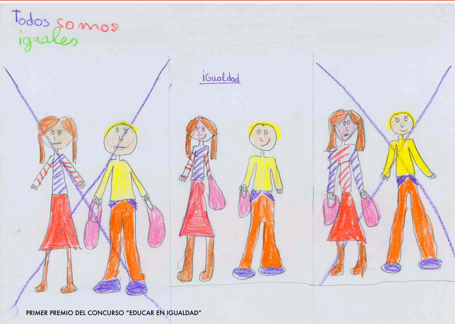
PRIMER PREMIO DEL CONCURSO "EDUCAR EN IGUALDAD"

El maestro que intenta enseñar sin inspirar en el alumno el deseo de aprender, está tratando de forjar un hierro frío.