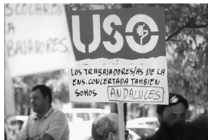
La USO manifestándose en solitario, dando ejemplo de coherencia y valentía.

en diversas reuniones, USO ha sido la única organización que, al no estar de acuerdo con la interpretación unilateral impuesta por la Consejería para calcular el importe del Complemento de Analogía Retributiva para 2002, hemos interpuesto el correspondiente Recurso Contencioso Administrativo. Lo hicimos el 19 de diciembre de 2001, a pesar de la presión de la Consejera, que incluso llegó a insinuar que si actuábamos ante los Tribunales de Justicia, podríamos no cobrar; lo que finalmente no ha ocurrido, como ya la USO aseguró y todos los trabajadores han podido comprobar.