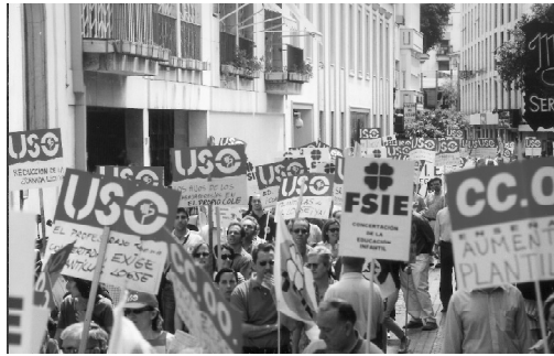
Compañeros de USO durante la manifestación hacia la Consejería de Educación. Sevilla 22 de Mayo de 2002

Está próximo a finalizar el que para nosotros ha sido un durísimo curso de movilizaciones contra la Consejería de Educación, tratando de abrir una Mesa de Negociación para abordar todas las reivindicaciones que quedaron pendientes tras el Acuerdo de 1999, con el Consejero Manuel Pezzi (plantillas, reducción de la jornada lectiva del profesorado, igualdad salarial ESO I y ESO II, concertación de la Edu-