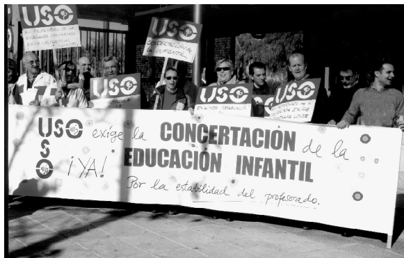
Compañeros de USO reclamando ante la Consejería de Educación de Andalucía la Concertación de la E. Infantil en las últimas movilizaciones

Definitivamente, para la Federación de Enseñanza de la USO, el anteproyecto de la Ley de Calidad mejora la igualdad de oportunidades y deja de marginar a los centros concertados al abordar la financiación de la Educación Infantil.