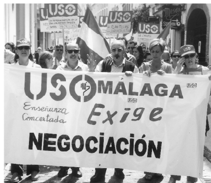
Varios centenares de trabajadores de USO de todas las provincias andaluzas participaron, como no podía ser de otra manera, en la manifestación.

¿A qué obedece esta actitud? Merece nuestra reflexión.