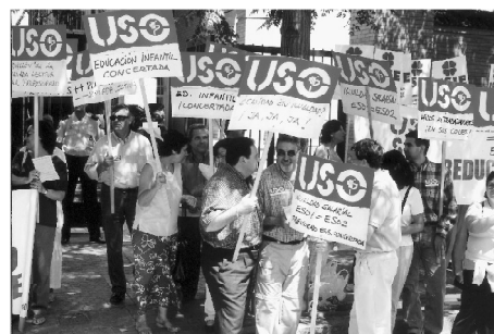
Concentración de trabajadores a las puertas de la Delegación de Educación, durante la primera jornada de huelga. Sevilla, 21 de Mayo de 2002