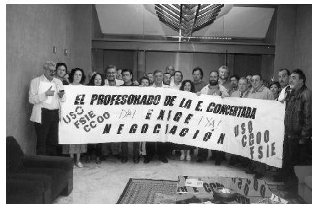
Encierro en la Consejería de Educación. Antesala del mismísimo despacho de la Consejera. Sevilla, 7 de Mayo de 2002